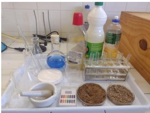
Materiais para a aula experimental

A experimentação poderá ser realizada no laboratório da escola ou em algum espaço alternativo. Também deve ser fornecida uma tabela, a fim de auxiliar os estudantes na resolução do problema.