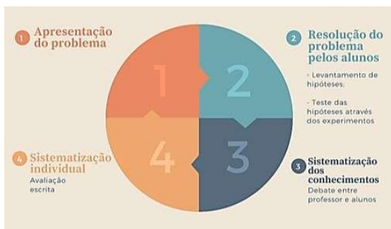
Etapas para a experimentação investigativa.

Considerando a realização da experimentação investigativa, Carvalho (2013) propõe quatro etapas, conforme mostrado na figura abaixo.